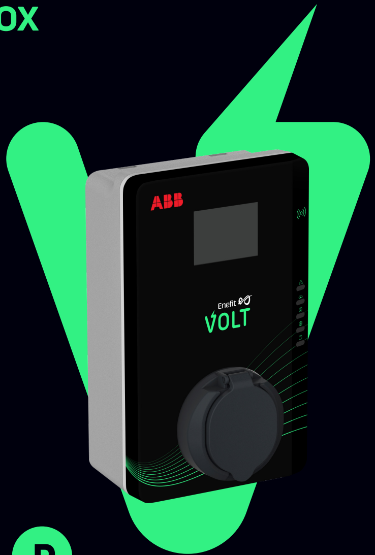
ABB Terra Wallbox on lihtne ja soodne ekraaniga elektriauto laadimisjaam, mis laeb kuni 7.4 kW võimsusega. Laadijat saab kasutada garaažides, parkimisplatsidel ja muudel privaatsetel aladel.

ABB Terra Wallbox ekraaniga on mõeldud kasutamiseks kodus või kontoris. Selle kvaliteetse laadija puhul on tagatud nii pikk tööiga kui töökindlus. Laadimisjaam on saadaval 1 faasiga 32 A.