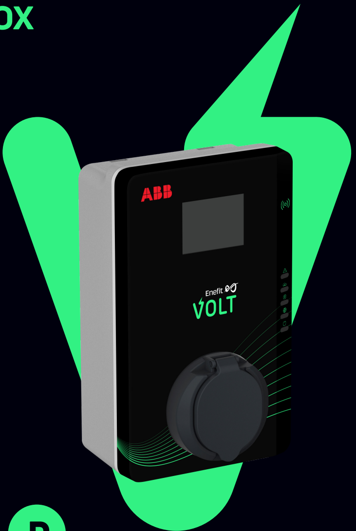
ABB Terra Wallbox on lihtne ja soodne ekraaniga elektriauto laadimisjaam, mis laeb kuni 22 kW võimsusega. Laadijat saab kasutada garaažides, parkimisplatsidel ja muudel privaatsetel aladel.

ABB Terra Wallbox ekraaniga on mõeldud kasutamiseks kodus või kontoris. Selle kvaliteetse laadija puhul on tagatud nii pikk tööiga kui töökindlus. Laadimisjaam on saadaval 3 faasiga 32 A.